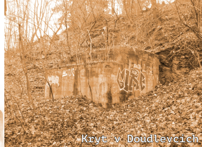
Kryt v Doudlevcích