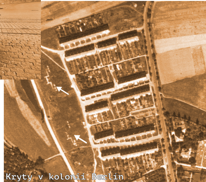
Kryty v kolonii Berlín

V době nacistické okupace během 2. světové války se město Plzeň několikrát stalo cílem spojeneckého bombardování. Tyto letecké útoky se snažily zasáhnout především Škodovy závody, které byly za války jedním z největších zbrojních komplexů v rukou hitlerovského Německa, dopadům leteckých pum se však nevyhnulo ani samotné město. A tak na území Plzně a v jejím okolí vyrostlo několik desítek protileteckých krytů, které během náletů poskytovaly útočiště představitelům okupační správy i místnímu obyvatelstvu.