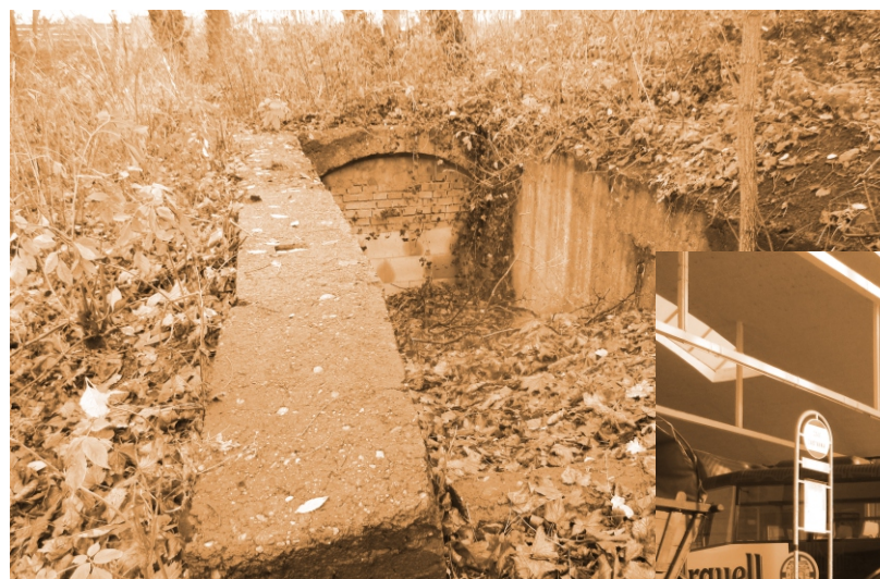
Kryt u hlavního nádraží