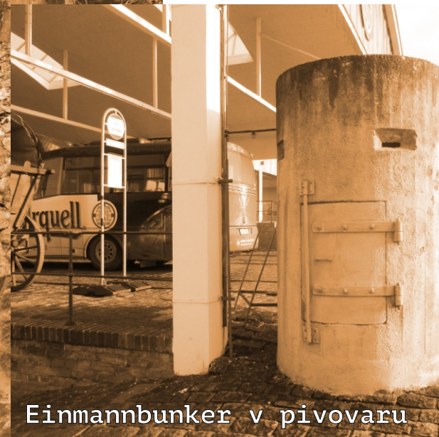
Einmannbunker v pivovaru