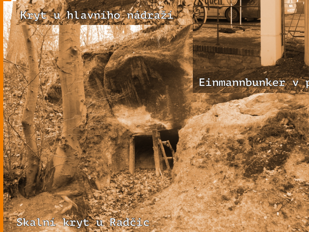
Skalní kryt u Radčic